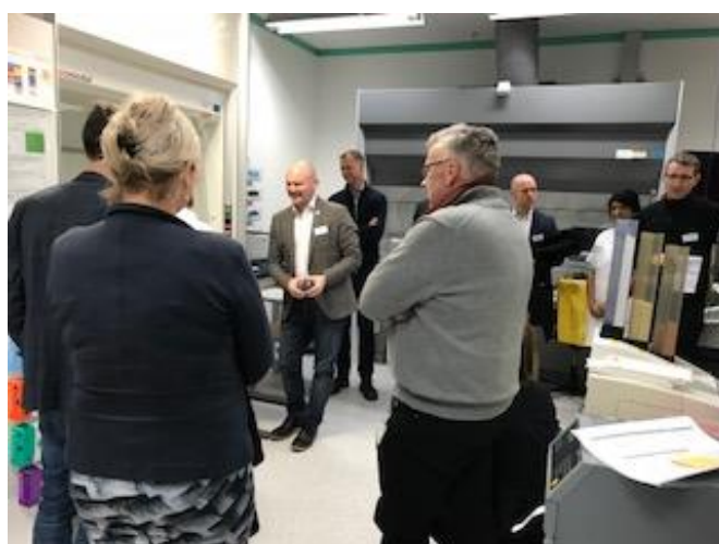
Præsentation af dele af det nye frysehus og vævshåndtering på Herlev Hospital